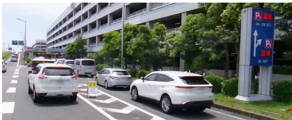
・満車駐車場への入庫待ちの車列の様子